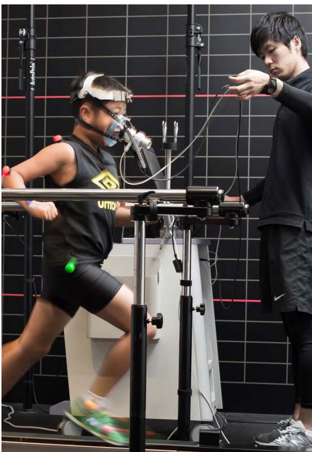
トップアスリートのトレーニングで小学生を鍛えている